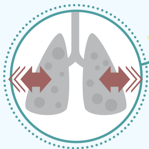
Respiration rapide, difficile